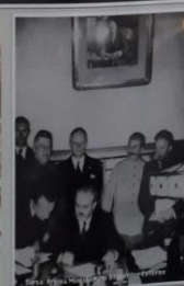
Preluarea de către sovietici a Basarabiei a fost stabilită prin acordul secret Ribbentrop - Molotov (23 august 1939) încheiat între Germania lui Hitler și Uniunea Sovietică a lui Stalin. În iunie 1940, sovieticii și-au extins pretențiile și asupra nordului Bucovinei și Hertzi.

Pogromul de la Dorohoi s-a produs pe fondul atmosferei tensionate create de retragerea precipitată din Basarabia și nordul Bucovinei, în urma ultimatumului dat de sovietici pe 26 iunie 1940.